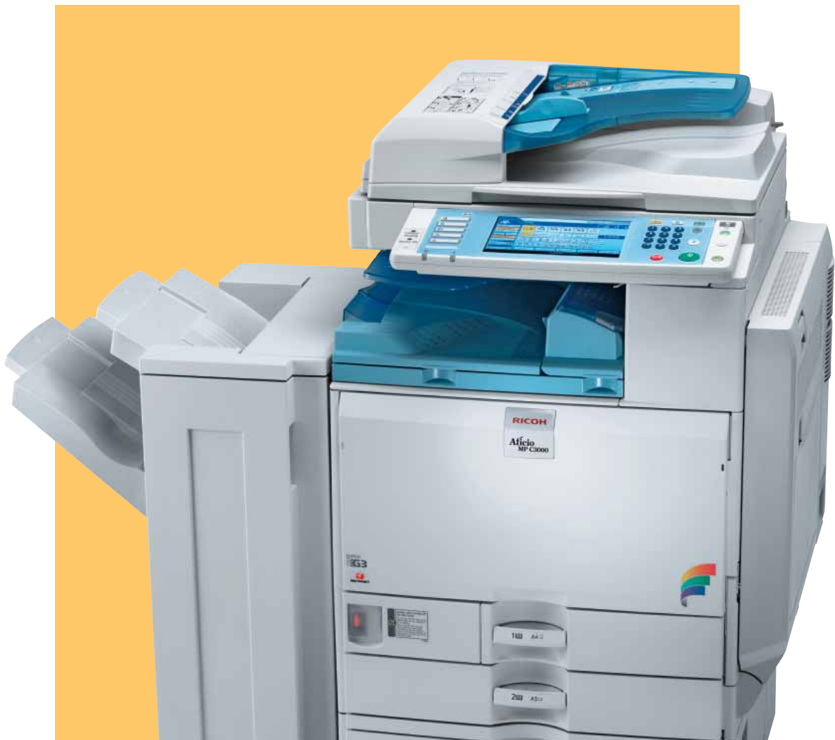
Aficio™ MP C2500/MP C3000